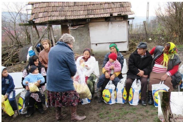
Tassen met boodschappen voor de gezinnen in Taureni