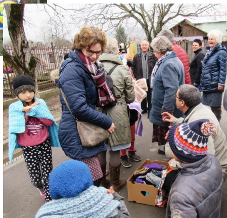
Kleding en gebreide mutsen en dekens voor de armen in Gherla