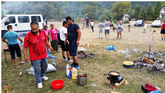
Kinder-knutselmiddag in Uioara en gemeente Barbecue in de natuur bij de Poort van Turda.